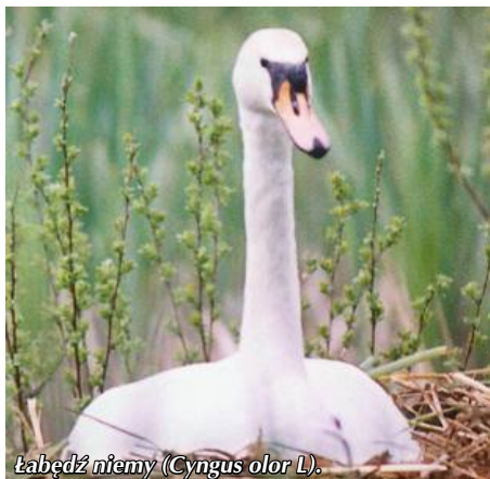
Łabędź niemy ( Cygnus olor L.).

Przybrzeżne szuwaro to miejsce gnieźdzenia się ptaków, takich jak: perkoz dwuczuby, łabędź niemy, kaczka krzyżówka, łyska, rybitwy: czarna i zwyczajna, trzciniak, wodnik.