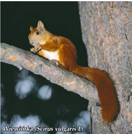
Wiewiórka (Sciurus vulgaris L.)

Są wśród nich owady roślinożerne i mogą wyrządzać szkody w lasach. Są też takie, które prowadzą pasożytniczy tryb życia (np. gąsieniczniki) i drapieżny (np. mrówki). Te należą do