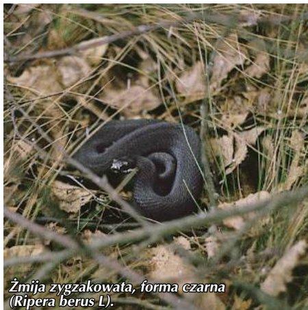
Żmija zygzakowata, forma czarna (Ripera berus L).

Są tu też liczni przedstawiciele ssaków drapieżnych: łasice, kuny, tchórze, lisy. Spotkać można jenota , mało znanego ssaka z rodziny psowatych, który przywędrował z Azji.