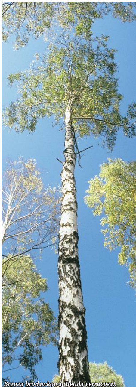
Brzoza brodawkowa ( Betula verrucosa ).