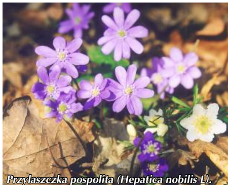
Przylaszczka pospolita (Hepatica nobilis L.)

Ścieżka „Nad Neliwą” znajduje się na połuniowym brzegu jeziora Neliwa. Swój początek ma w lesie 150 metrów za przejazdem kolejowym, przy szosie z Rybna do Kostkowa (Ostaszewa). Najłatwiej dojechać tu samochodem lub pociągiem do stacji kolejowej PKP w Rybnie, a stąd pieszo polną drogą wzdłuż torów (1,5 km) do szosy Rybno – Kostkowo.