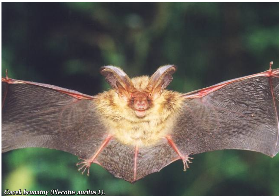
Gacek brunatny (Plecotus auritus L).