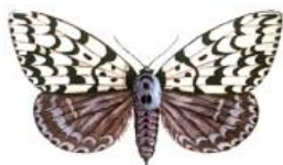
Brudnica mniszka ( Lymantria monacha )