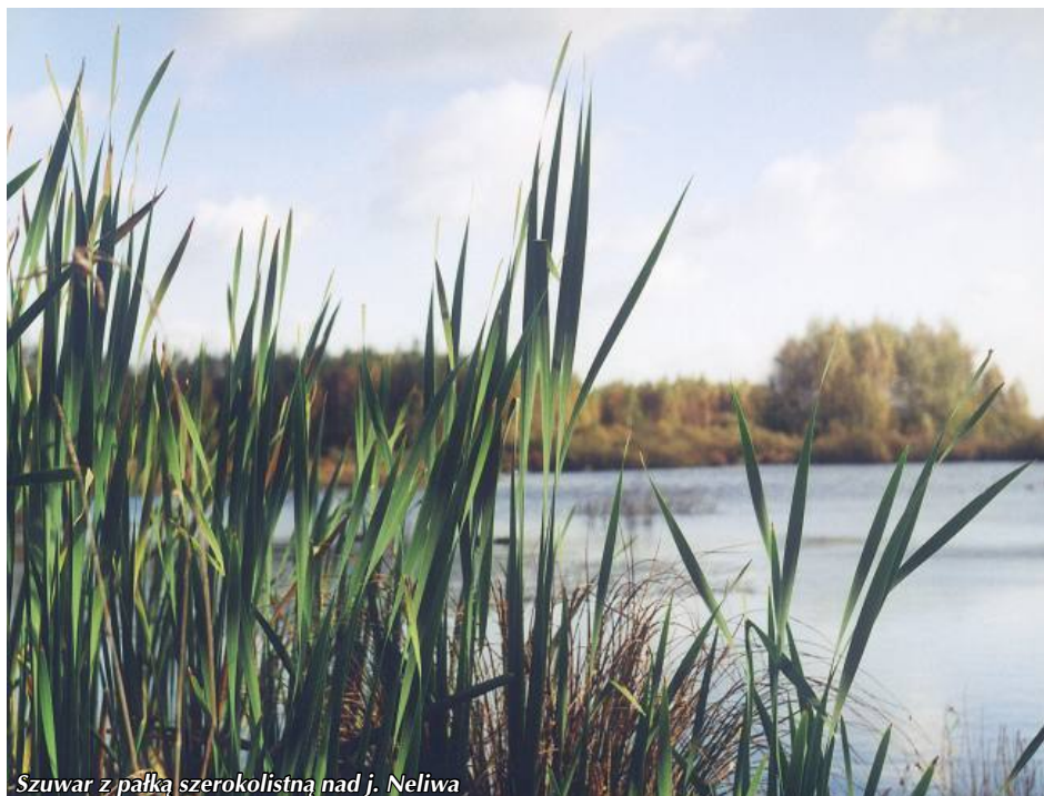
Szuwar z palką szerokolistną nad j. Neliwa