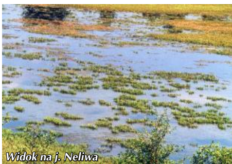
Widok na j. Neliwa

wych jezior głównie tym, że jest stosunkowo niewielkie i płytkie. Położone jest na wysokości 152 m.n.p.m. Bezpośrednie otoczenie jeziora stanowią: lasy (76%) oraz łąki i tereny podmokłe i zabagnione (16%). Jego wody nie są wykorzystywane rekreacyjnie i mieszczą się w II klasie czystości.