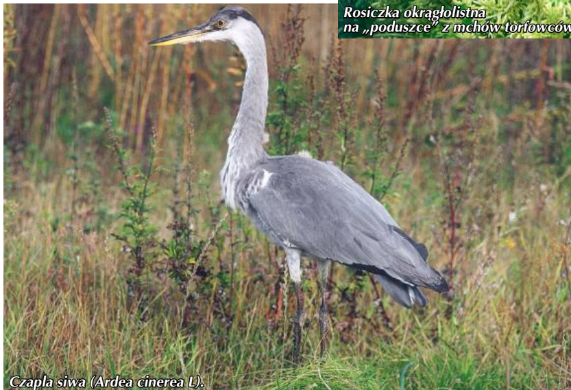
Czapla siwa (Ardea cinerea L.)