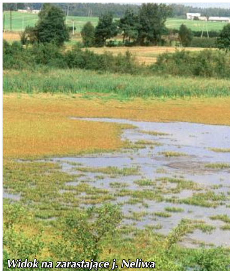
Widok na zarastające j. Neliwa

Następny przystanek z platformą widokową usytuowany jest na zboczu, z którego widać północno – zachodni brzeg jeziora Neliwa.