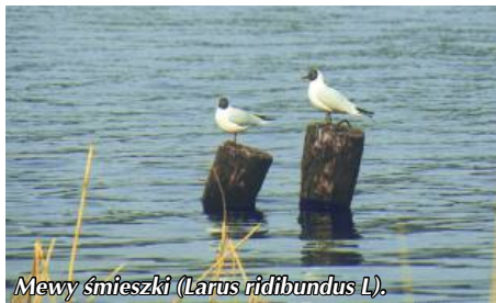
Mewy śmieszki ( Larus ridibundus L.).

Z platformy można zaobserwować wiele gniazdujących i przelatujących tu ptaków. Wystarczy lornetka i odrobina cierpliwości.