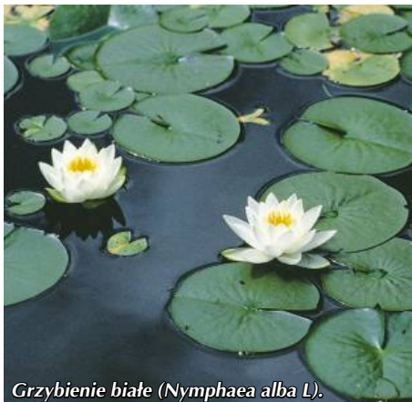
Grzybienie białe (Nymphaea alba L).

organizmami roślinnymi i zwierzęcymi sypca znacznie jezioro. W miejscach płytkich tworzą się rozległe zbiorowiska roślin o liściach pływających. Jezioro Neliwa znajduje się w końcowej, naturalnej fazie swojego życia. Zapewne już niedługo przekształci się w torfowisko niskie , które porośnie las olszowy będący ostatnim etapem sukcesji roślinności na torfowiskach niskich.