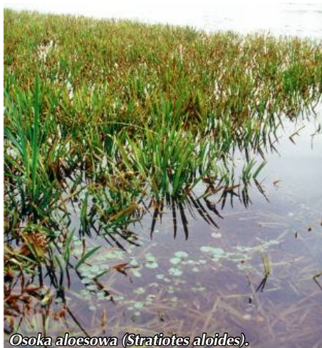
Osoka aleosowa (Stratiotes aloides).

Według geologicznej miary czasu jeziora nie są tworami trwałymi. W toku rozwoju obserwuje się ich starzenie . Odkładająca się rocznie warstwa osadów dennych z rozkładającymi się