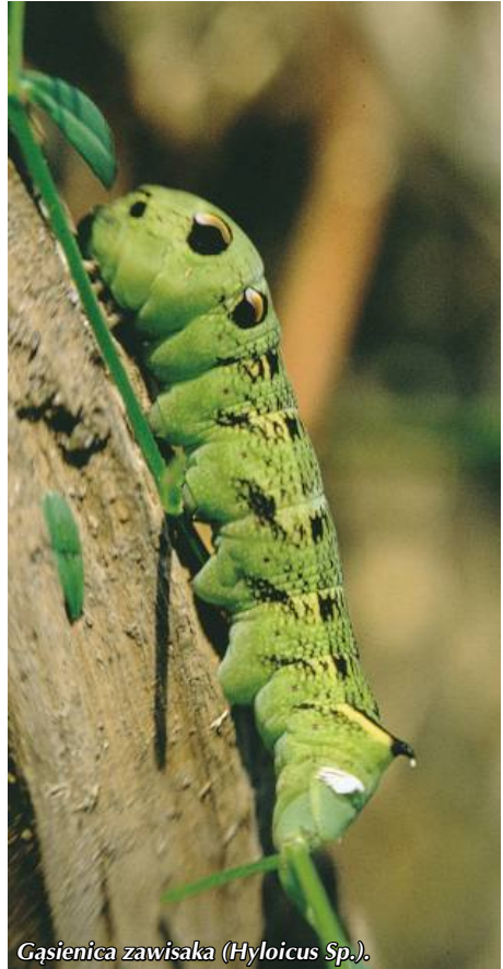
Gąsienica zawisaka (Hylcoicus Sp.)

Wśród mieszkańców lasu są liczni przedstawiciele płazów (żaby, ropuchy) i gadów (jaszczurki, żmije, zaskrońce). Zwierzęta te są obecnie zagrożone z wielu powodów; przede wszystkim przez osuszanie terenów potrzebnych do składania jaj, a także przez sieć dróg przecinającą obszary leśne. Żyje tu nasz jedyny jadowity gad – żmija zygzakowata . Dla lasu jest to